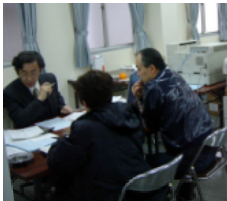
あらゆる相談に対応しています

独立開業をめざす方 法人を設立しようという方 経営の革新を考えている方 「このままではだめ」とお考えの方 いろいろ悩まれている方